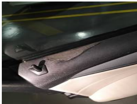
Porte avant gauche (Autre Défaut)