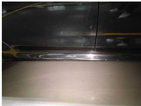
Bas de caisse droite (Impact)